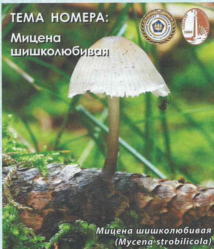
Мицена шишколюбивая ( Mycena strobilicola )